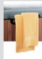
Штанга для полотенца