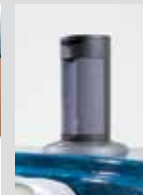
Водонепроницаемая музыкальная система