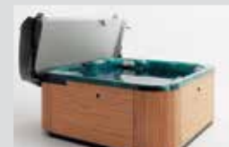
Подъёмник для чехла бассейна

• Автоматическая система заполнения и слива